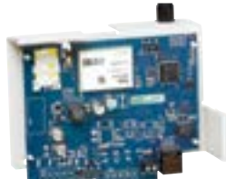
TL2803G Transmetteur GSM/3G et IP Communication sur réseau 3G Application smartphone Télémaintenance, télégestion Cryptage données AES 128 bits Antenne fournie