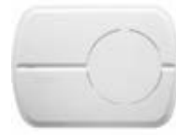
PC5964 Micro / HP full duplex piezzo