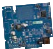
TL280 Transmetteur IP Application smartphone Télémaintenance, télégestion Cryptage données AES 128 bits