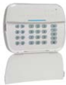
NEOLED Clavier LED