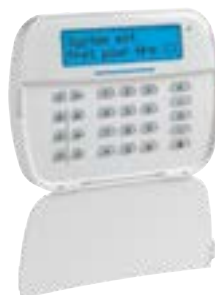
NEOLCDRF Clavier LCD 32 caractères avec récepteur radio intégré