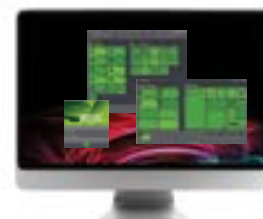
WEBSA Logiciel administrateur de système