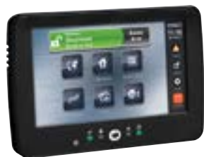
NEOTOUCHNOIR Clavier à écran tactile 7" avec lecteur de proximité, noir 1 badge fourni