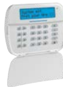
NEOLCDRFP Clavier LCD 32 caractères avec récepteur radio et lecteur de proximité 1 badge fourni