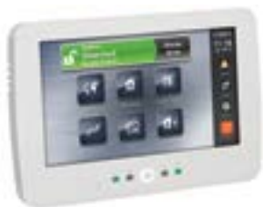
NEOTOUCH Clavier à écran tactile 7" avec lecteur de proximité 1 badge fourni