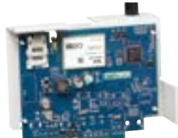
3G2080 Transmetteur GSM/3G Communication sur réseau 3G Application smartphone Télémaintenance, télégestion Cryptage données AES 128 bits Antenne fournie